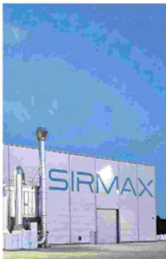
LO STABILIMENTO di Cittadella della Sirmax che esce dal periodo più buio della crisi pandemica con dati molto incoraggianti